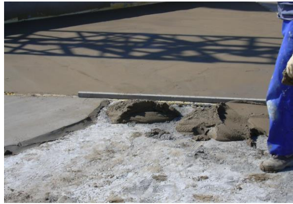
Fig. 1: Ejecución de paños de la formación de pendientes