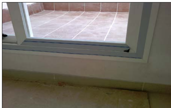
Fig. 2: Montaje de puerta corredera de acceso a una terraza