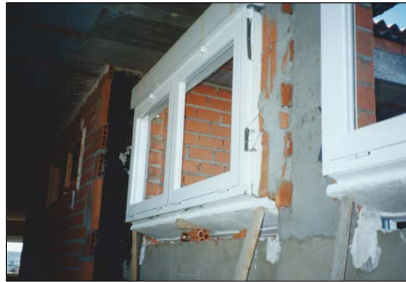
Fig. 1: Fijación de carpintería de aluminio y de vierteaguas

Denominamos ventana al hueco realizado en un paramento, a cierta altura del nivel del suelo, al objeto de proporcionar luz y ventilación, al cual se le incorpora un elemento constructivo opaco perimetral como bastidor, al que se le incorpora un vidrio en su parte central. Esta disposición lleva pareja, en su caso, otros complementos como son persianas y contraventanas; estas últimas pueden ser exteriores (mallorquinas) o interiores (fraileros). A continuación veremos las condiciones genéricas y específicas de proyecto que deben considerarse.