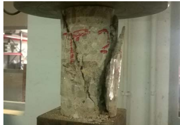
Fig. 2: Rotura a compresión probeta hormigón