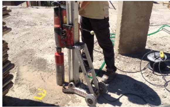
Fig. 1: Extracción probeta testigo de hormigón

La realización de los ensayos de información, su planificación, así como los estudios de seguridad y los proyectos de refuerzo, en su caso, requieren la intervención de técnicos especializados.