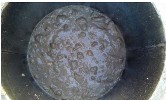
Fig. 4: Compactado de probetas cilíndricas

En este sentido, en la extracción de probetas testigos de hormigón en elementos verticales, como pilares y muros, dependiendo donde se produzca la extracción (parte superior o inferior), se pueden obtener valores de resistencia de los hormigones con diferencias notables (10 a 30%), como consecuencia del asentamiento del hormigón debido a una inadecuada consistencia y/o compactado.