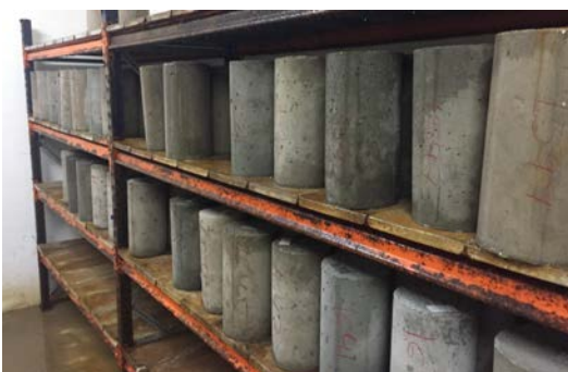
Fig. 6: Curado de probetas cilíndricas en cámara de húmedos