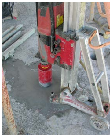
Fig. 8: Extracción probetas testigos

Entre los ensayos no destructivos pueden considerarse los ensayos normalizados en UNE-EN 12504-2 relativos a la determinación del índice de rebote y la UNE-EN 12504-4, a la velocidad de propagación de ultrasonidos . La fiabilidad de sus resultados está condicionada a combinar estos ensayos con la extracción de probetas testigo.