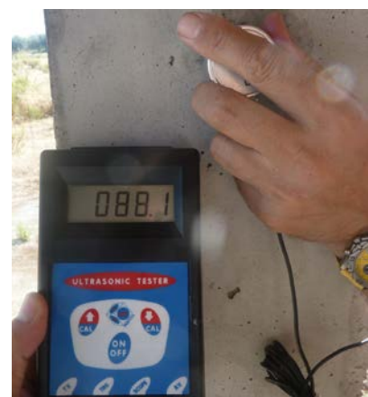
Fig. 10: Velocidad de propagación de ultrasonidos

En este documento nos vamos a centrar en los ensayos de información mediante la extracción y rotura a compresión de probetas testigos de hormigón.