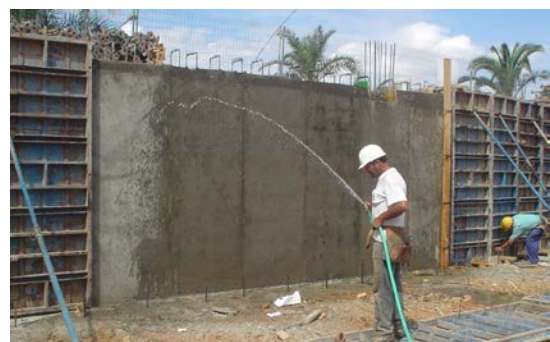
Fig. 7: Curado del hormigón en obra