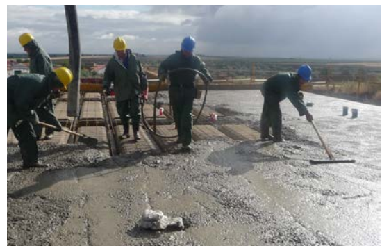
Fig. 5: Vertido y compactado del hormigón en obra