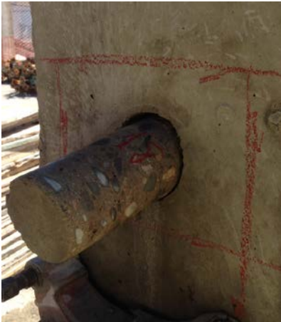
Fig. 11: Testigo de hormigón de 75 mm de diámetro en pilar

En los casos de estructuras densamente armadas pueden emplearse testigos de un diámetro de 75 mm si el tamaño máximo del árido es igual o menor de 20 mm .