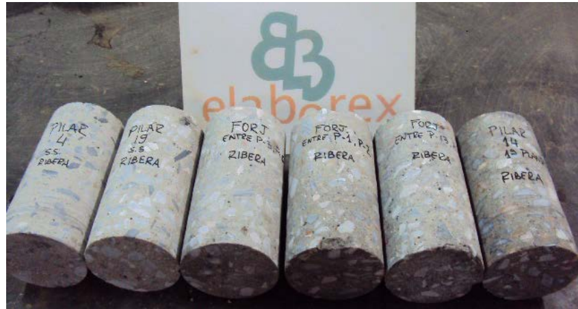
Fig. 12: Testigos de hormigón de 100 mm de diámetro

La norma UNE-EN 13791 sugiere que la evaluación de la resistencia del hormigón en una región determinada (uno o varios elementos estructurales que forman parte de la misma población), debe estar basada en los resultados de al menos tres testigos de 100 mm de diámetro. Para testigos de 50 mm de diámetro, el número se triplica.