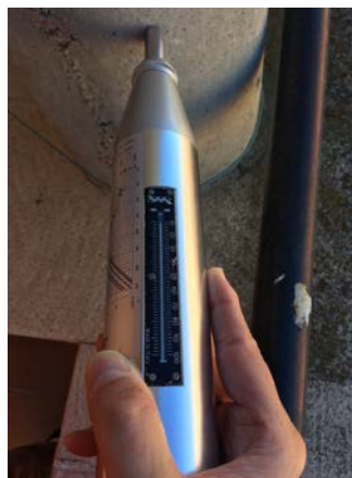
Fig. 9: Índice de rebote. Esclerómetro